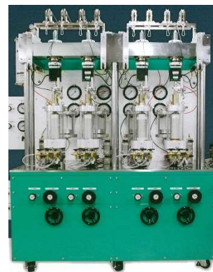
4 連式三軸圧縮試験機