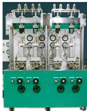
4 連式三軸圧縮試験機