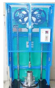
自動突き固め装置