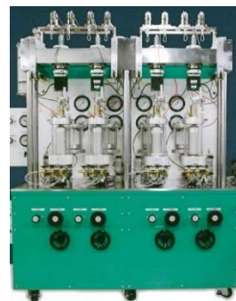
4 連式三軸圧縮試験機