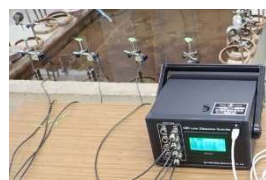
C B R 自動記録装置