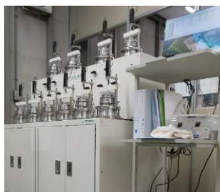
空圧式全自動圧密試験機