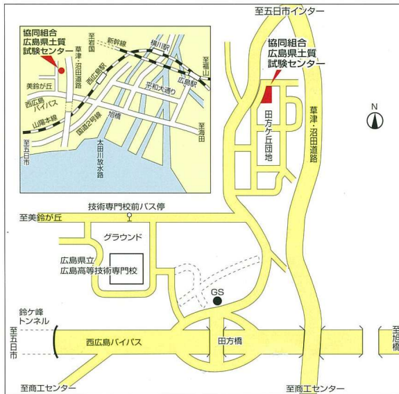
◎五日市ICから車で10分 ◎西広島バイパス田方陸橋から車で5分